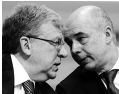
Финансисты – «реформаторы» Кудрин и Силуанов

Очередное и уже четвертое по счету назначение Путина на президентскую должность смотрящего за Россией в результате спецоперации «Выборы президента-2018» в середине мая увенчалось формированием «нового» старого правительства путинского доверия. 18 мая президент РФ В.Путин подписал указы о назначениях членов правительства, в котором вице-премьеров оказалось как блох на бобике: аж целых десять. Налицо «наследственная аристократия»: путинские, медведевские и т.п. – таков расклад сил в новом правительстве.