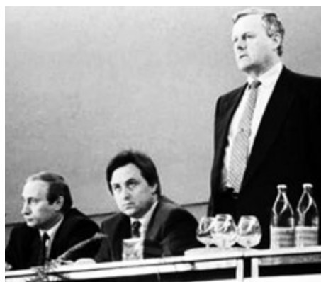
Мутко в центре

Вверх по служебной лестнице по полз также старый дружок Путина мутный В. Мутко, деятельность которого на министерстве спорта привела к дискредитации Олимпийской сборной России и запрет на участие в Олимпиаде. О других злоупотреблениях, в том числе в строительстве сочинских объектов написано немало и за немением времени на этом останавливаться не будем: каждый может почитать о его художественный проделках в сети Интернет. Теперь этот «герой» спорта стал куратором строительства и региональной политики назначен.