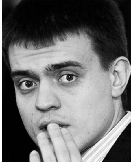
Нарочно не придумаешь. М. Котюков – главный по науке.

создано, чтобы лишить Российскую академию наук земель, зданий, лабораторий и прямого финансирования, отдав все это новому бюрократическому распорядителю – ФАНО, чтобы средства, выделенные на науку были в руках далекой от науки бюрократии из числа «эффективных менеджеров». Результат от таких решений – налицо! Российская наука погибает!