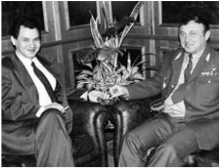
Шойгу и Грачев – соучастники расстрела высшего законодательного органа страны – Верховного Совета РСФСР. С этого началось безнаказанное уничтожение России Ельциным и его подельниками.