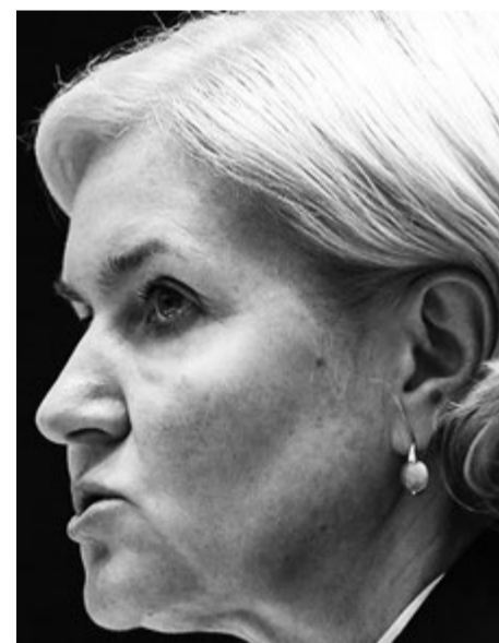
Та самая Голодец, поставившая жизнь ученых и бюджетников на грань выживания. Таким не «социальным государством» руководить, а работать в гестapo.