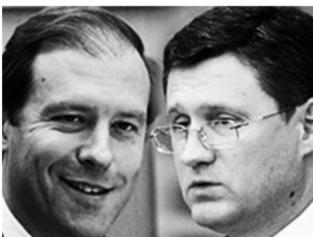
«Гарвардские мальчики» – Мантуров и Новак.

Министерства, связанные с экономикой, природными ресурсами и крупными инвестициями были распределены среди ставленников крупных олигархов и друзей президента, контролирующих крупные отрасли экономики. Министр промышленности и торговли переназначен представителем группы Чемезова Д. Мантуров, министром энергетики – А. Новак (группа Сечина). Министерство природных ресурсов и экологии возглавил Д. Кобылкин (человек Тимченко, дружный с Сечиным, Ротенбергами и др. крупными капиталистами). Ведь от того, кто управляет природными ресурсами зависит баснословная прибыль капиталистов и монополий. На пост министра транспорта назначен ставленник и воспитанник гайдаровско-чубайсовских младореформаторов 90-х гг. Е. Дитрих, который в ту пору был у них на побегушках в Госкомимущество.