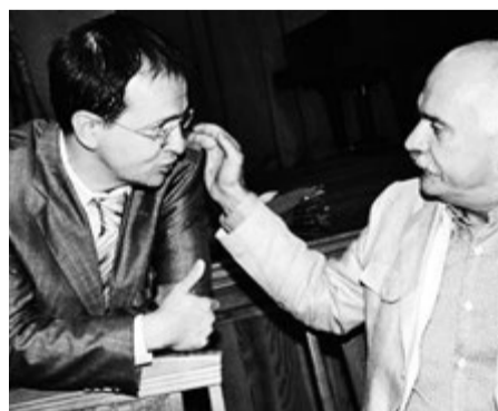
Мединский – протезе Михалкова